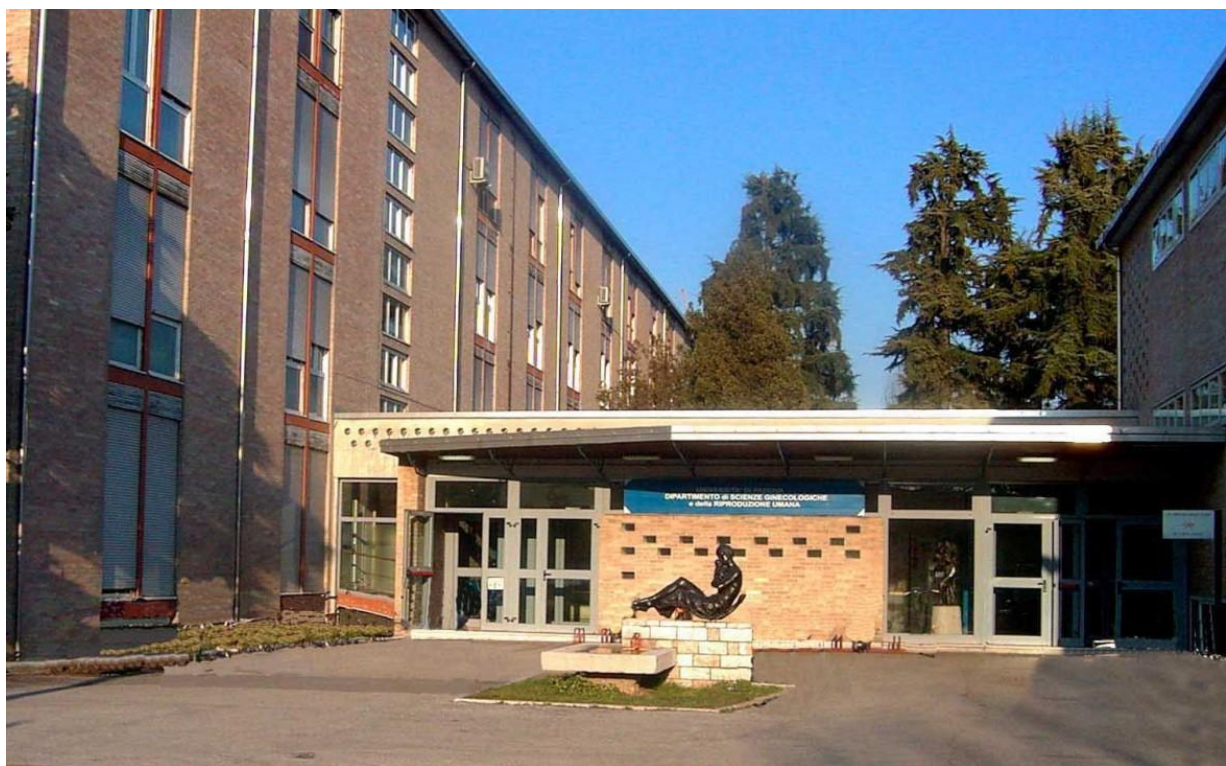
Ingresso Principale Clinica Ginecologica e Ostetrica